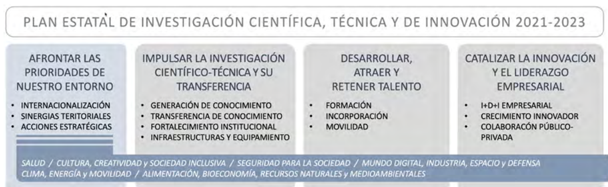
Gráfico 1: Estructura del PEICTI 2021-2023.

Acciones Estratégicas con el objetivo de cohesionar las políticas sectoriales en I+D+I, sino que guían, de manera implícita, la visión estratégica y el enfoque temático de todos los Programas y Subprogramas Estatales.