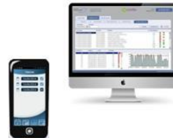
(3) Cloud Medical Dispenser