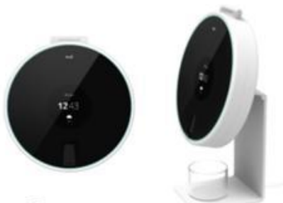
(2) Home Medical Dispenser